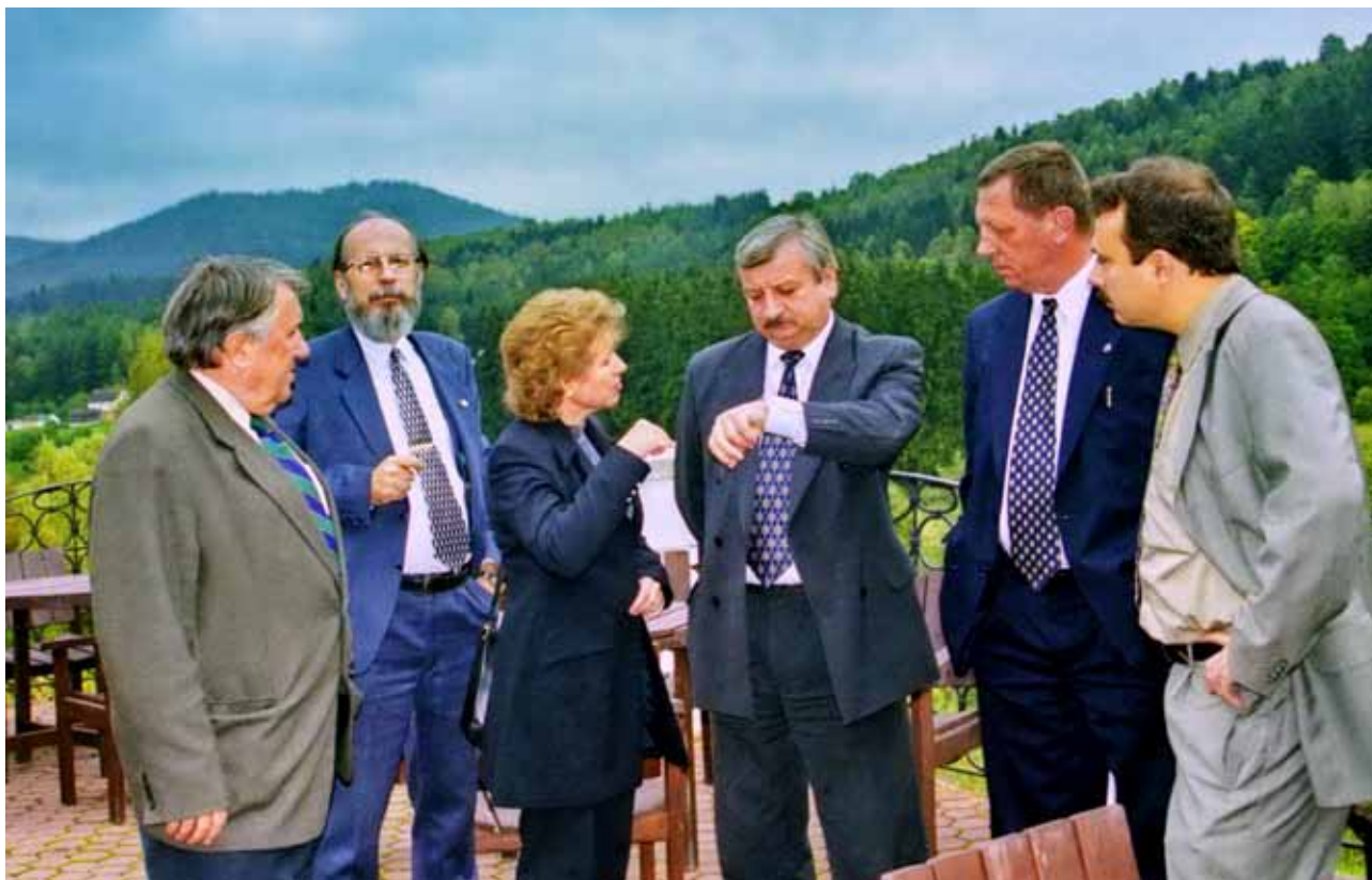
Stretnutie ministrov životného prostredia V4 venované otázkam energetiky, životného prostredia, výmene informácií a skúseností z prípravy na členstvo EÚ (Český Krumlov, 1999).

mi, štátnymi tajomníkmi (17) a vedúcimi úradu (11). Do pôsobnosti MŽP vtedy prešli aj kompetencie zrušeného Slovenského geologického ústavu. V dôvodovej správe sa zrušenie SKŽP zdôvodnilo týmito slovami: „Existujúca forma ústredného orgánu štátnej správy s kolektívnym vedením sa počas svojho pôsobenia neosvedčila“.