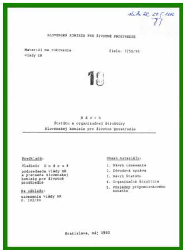
Obr. 3. Návrh štatútu organizačnej štruktúry Slovenskej komisie pre životné prostredie (Bratislava, máj 1990).