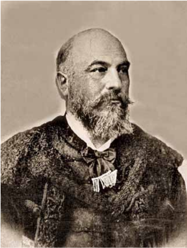
Obr. 1. Uhorský minister pôdohospodárstva Ignác Darányi – významná osobnosť inštitucionalizácie starostlivosti o životné prostredie.