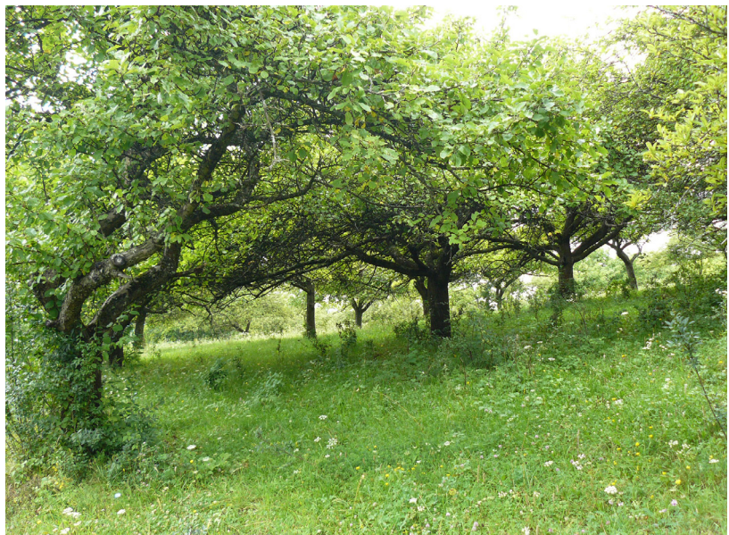
Obr. 2. Pravidelne obhospodarované ovocné sady pri Lipovníku (okres Rožňava, 2009).

Legenda: Prírodno-sídelné spádové regióny (Miklós, 2002): 1. Bratislavský metropolitný, 2. Záhorský, 3. Podunajský, 4. Trnavský, 5. Ponitriansky, 6. Dolnohronsko-dolnoipeľský (Hontský), 7. Považský (Trenčiansko-žilinský), 8. Turčiansko-liptovsko-oravský, 9. Pohronský, 10. Gemersko-novohradský, 11. Spišský, 12. Košický, 13. Šarišský, 14. Dolnozemplínsky, 15. Hornozemplínsky; Typy HŠPK: A. typ HŠPK rozptýleného osídlenia s prítomnými ovocnými sadi, B. typ vinohradnicke HŠPK s prítomnými ovocnými sadi, C. typ oráčino-lúčno-pasienkovo-sadové HŠPK s prítomnými ovocnými sadi