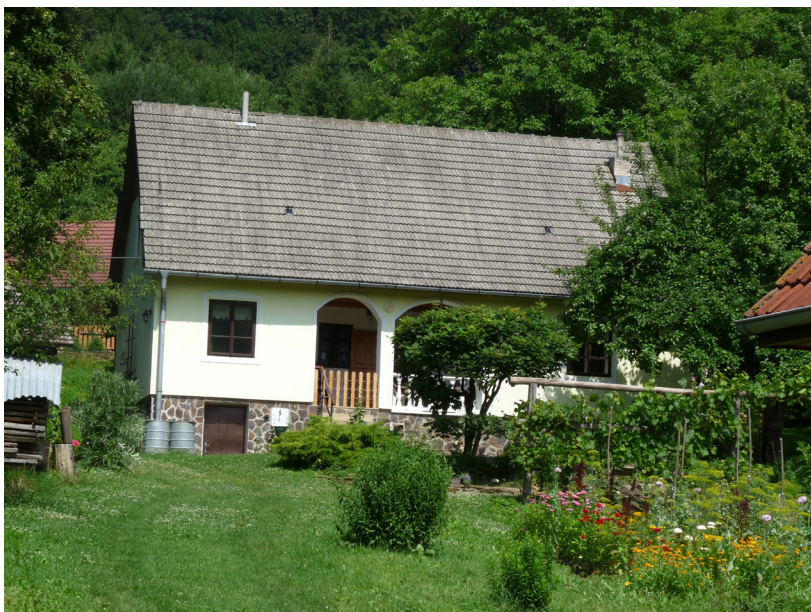
Obr. 3. Zrekonštruovaný dom na Bošáckych kopaniciach, časť Šiance (okres Nové Mesto nad Váhom, 2011).

medziach, lúkach a pastvinách sa vyskytujú „Vinohradnícka broskyňa“ – broskyňa obyčajná ( Persica vulgaris ), marhule „Bohutická“, „Veľkopavlovická“, orech kráľovský ( Juglans regia var.) a višne ( Prunus cerasus var.), slivky „Gulovačky“, „Kozie cecky“, „Štolcove slivky“, „Kolomaznice“, hrušky „Krvavky“ a „Medule“ a podobne (Mertan, 1997).