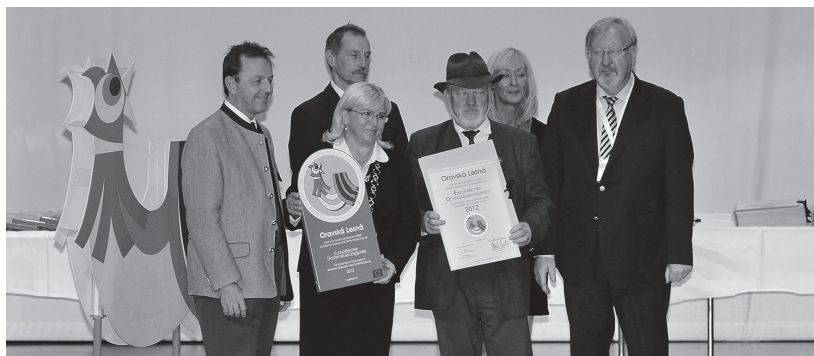
Obr. 3. Preberanie Európskej ceny obnovy dediny za mimoriadne výsledky v jednotlivých oblastiach rozvoja dediny zástupcami obce Oravská Lesná v Langeneggu (2012).

Ing. Martin Lakanda, martin.lakanda@sazp.sk Slovenská agentúra životného prostredia, Tajovského 28, 975 90 Banská Bystrica