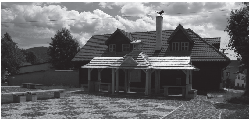
Obr. 2. Revitalizácia verejného priestranstva financovaná z Programu obnovy dediny – obec Pohorelá (2009).

Miera úspešnosti žiadostí je 23,29 %. Medzi okresy s najväčšou zapojenosťou do POD patria okresy Brezno, Čadca, Detva, Liptovský Mikuláš, Poltár a Zlaté Moravce (k 31. 10. 2012).