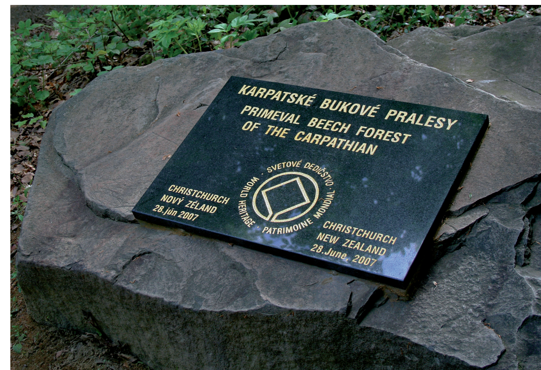
Karpatské bukové pralesy ako súčasť svetového prírodného dedičstva od roku 2007. Pamätná tabuľa pri Morskom oku v Chránenej krajinskej oblasti Vihorlat (2008).

Legenda: Obce zaradené podľa realizačného projektu (RP): 1 – 1. RP (zapojených 190 obcí v roku 2011), 2 – 2. RP zadržiavanie dažďovej vody v intravilánoch obcí (zapojených 20 obcí v roku 2012), 3 – 2. RP obnova a revitalizácia intravilánov miest a obcí (zapojených 20 obcí a miest v roku 2012), 4 – 2. RP (zapojených 348 obcí od októbra 2011 do marca 2012), 5 – štátna hranica, 6 – hranice povodí