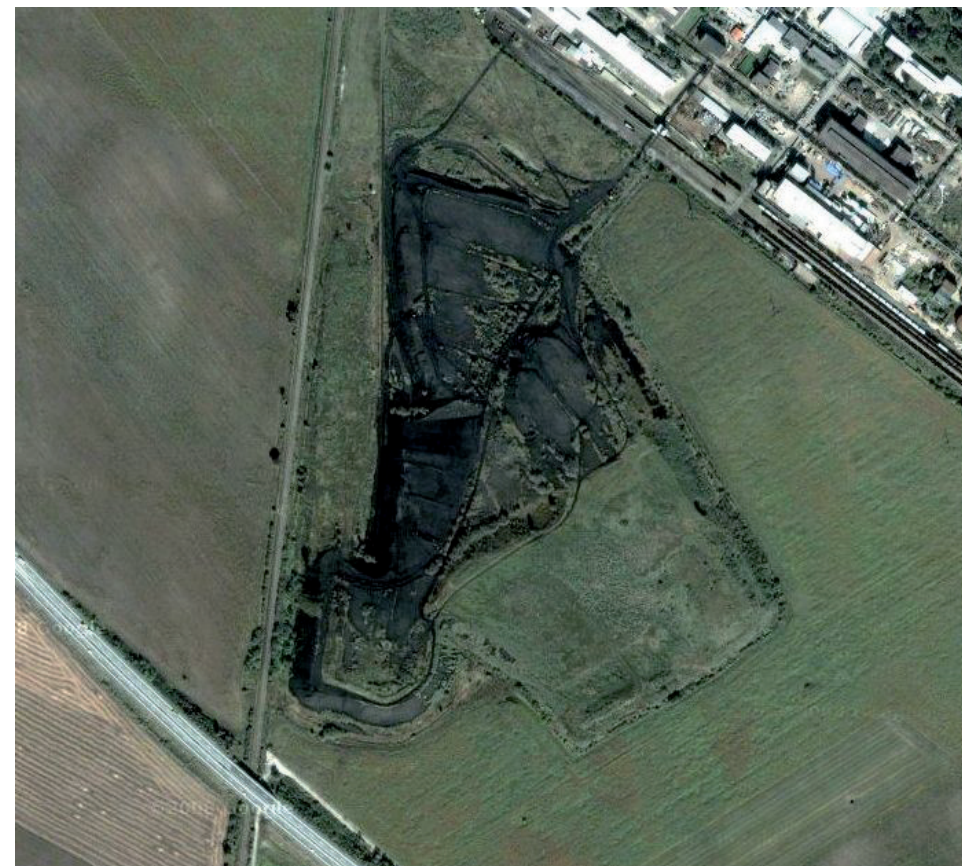
Obr. I. Satelitná snímka skládky lúženca pri Seredi.