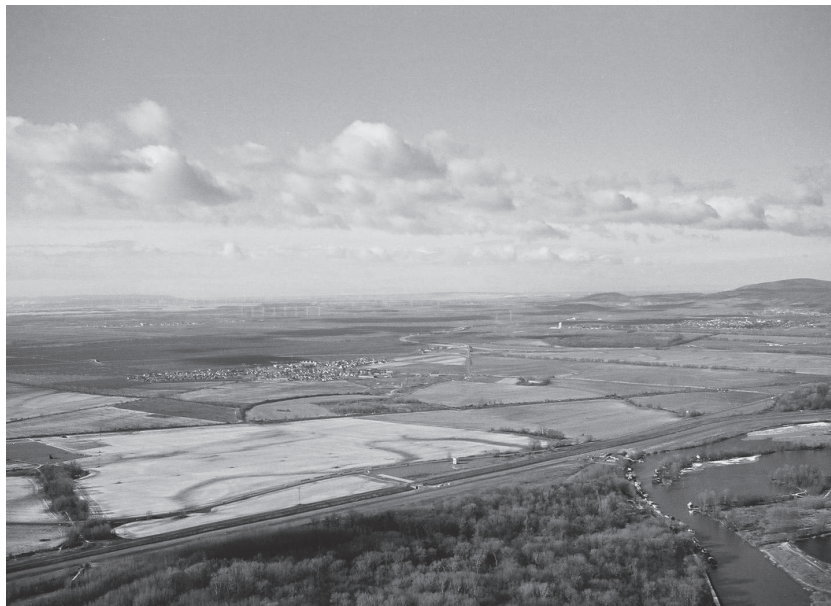
Obr. 2. Južná časť slovensko-rakúskeho prihraničného priestoru (urbanistická štúdiá Urbanistické formulovanie priestorov IV. kvadrantu v súvislosti s protipovodňovou ochranou pre návrh ÚPN).

V r. 2003 a 2004 boli vypracované dve urbanistické štúdiá (UŠ) – Formovanie územného rozvoja pozdĺž západného biokoridoru Petržalky a Urbanistické formulovanie priestorov IV. kvadrantu v súvislosti s protipovodňovou ochranou pre Návrh územného plánu hl. mesta SR (ÚPN). Vychádzali z 3. variantu Konceptu riešenia ÚPN hl. mesta SR Bratislavy a z rozvíjania tiež obnovy ramenných systémov na pravom brehu Dunaja – územie Petržalky s pokračovaním cez Jarovce, Rusovce až do Čunova – definovaných už v UŠ Západná rozvojová os Petržalka – Juh (obr. 1 a 2). V súvislosti s novými požiadavkami na protipovodňovú ochranu Bratislavy bola overovaná možnosť trasovania „obtokového ramena“, splavného pre rekreačné plavidlá, vytváraného tak, aby bolo jednou z priestorovo-kompozičných osí v území a zároveň mohlo svojimi parametrami plniť funkciu obtoku pre „veľkú vodu“. Okrem rozvíjania tiež formovania budúceho územného rozvoja pravobrežnej časti Bratislavy na doposiaľ neurbanizovaných plochách bolo cieľom štúdií nájsť potenciálne miesto trasovania a ponechania územnej rezervy pre obtokové rameno do budúcnosti, v prípade ďalšie-