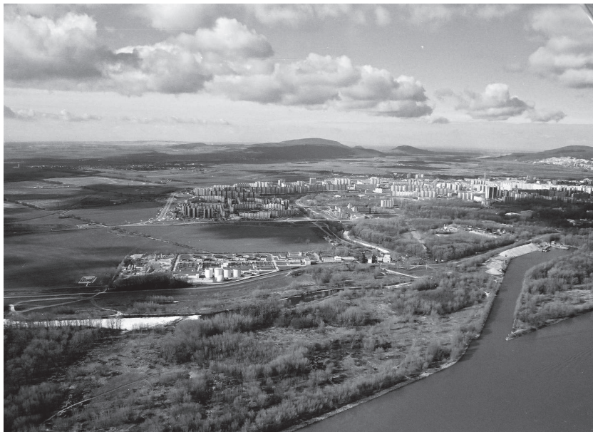
Obr. 1. Severná časť slovensko-rakúskeho prihraničného priestoru (urbanistická štúdia Urbanistické formulovanie priestorov IV. kvadrantu v súvislosti s protipovodňovou ochranou pre Návrh územného plánu hl. mesta SR Bratislavy). Foto: V. Hrdý, 2004

Štátna hranica s Rakúskom vo vzdialenosti troch kilometrov od stredu mesta, Bratislavského hradu, v minulosti limitovala možnosť rozvoja mesta juhozápadným smerom. V hraničnom priestore s Rakúskou republikou nebolo možné plánovať rozvojové aktivity. Odstránením politických bariér, vstupom Slovenska do EÚ a otvorením Schengenského priestoru sa vytvorili celkom nové podmienky aj pre oblasť územného plánovania. Prihraničné rakúske obce prevažne vidieckeho charakteru pociťujú už v súčasnosti vplyv mesta Bratislavy na svoj rozvoj. Veď niektoré z nich, napr. Kittsee, Wolfsthal alebo Berg, sa nachádzajú bližšie k centru mesta Bratislavy ako niektoré jeho vlastné mestské časti a územne prirodzene inklinujú k jeho spádovému územiu.