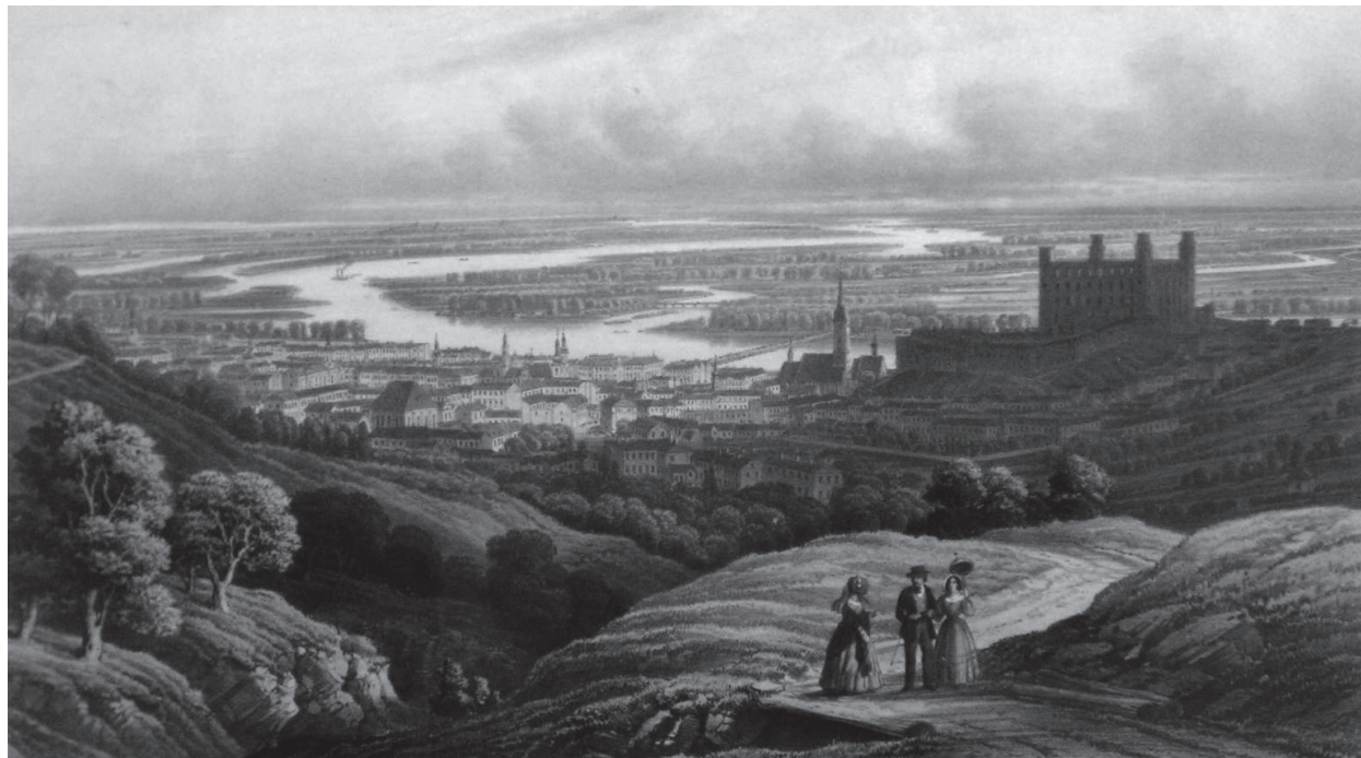
Bratislava v polovici 19. storočia, dunajské ramená v pozadí (historická veduta)

Magistrát hlavného mesta SR Bratislavy, Oddelenie koordinácie územných systémov, Primaciálne nám. 1, 814 99 Bratislava