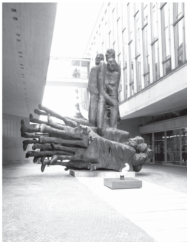
Pamätník SNP v Banskej Bystrici so súsoším Jozefa Jankoviča: Obete varujú, 1964 – 1969. Vpravo detail.

pín budovy a je aj autorom ústredného súsošia Obete varujú . Dielo sa stvárnením témy diametrálne líši od vžitej a propagandou pretlačanej verzie Povstania. Oficiálna rétorika vždy zdôrazňovala myšlienku víťazstva, ktorá bola vlastne lživá, pretože SNP nebolo vojensky úspešné, aj keď predstavovalo kľúčovú udalosť v moderných slovenských dejinách. Dielo Obete varujú , naopak, hovorí o cene, ktorú bolo treba zaplatiť, o jeho dôsledkoch na životy ľudí. Expresívne znázornenie mŕtvych v opozícii k živým, ležiacich a stojacich figúr je poctou obetiam. Osudy súsošia, rovnako ako priebeh prípravy realizácie Pamätníka SNP v Banskej Bystrici, symptomaticky poukazujú na závislosť výtvarného umenia vo verejnom priestore od aktuálnej politicko-spoločenskej situácie. Nekonečné spory o jeho podobu a absurdné zmeny sú odrazom zlomov a premien, ktoré prebiehali v slovenskej spoločnosti od konca 50. rokov po začiatok 70. rokov minulého storočia. Už r. 1970 sa začalo uvažovať o odstránení sochy z Pamätníka, čo sa o rok aj uskutočnilo, r. 1974 ju umiestnili v Národnej kultúrnej pamiatke Kalište na mieste vypálenej obce. Na pôvodné miesto sa dostala až r. 2004.