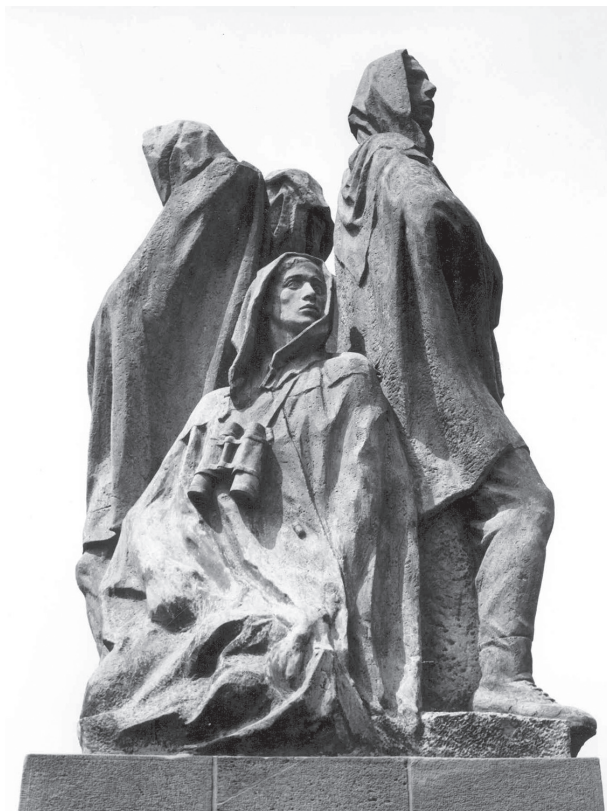
Jozef Kostka: Pamätník SNP v Partizánskom, 1946 – 1950.

k hrdinskému typu tvrdého chlapa sa pridali plačúce ženy a deti, takže zobrazenie bolo často na hranici sentimentálneho pátosu. Podobné boli scény víťania sovietskeho vojaka-osloboditeľa, prípadne zachytenie chlapského stretnutia partizána (robotníka, roľníka) s ruským vojacom.