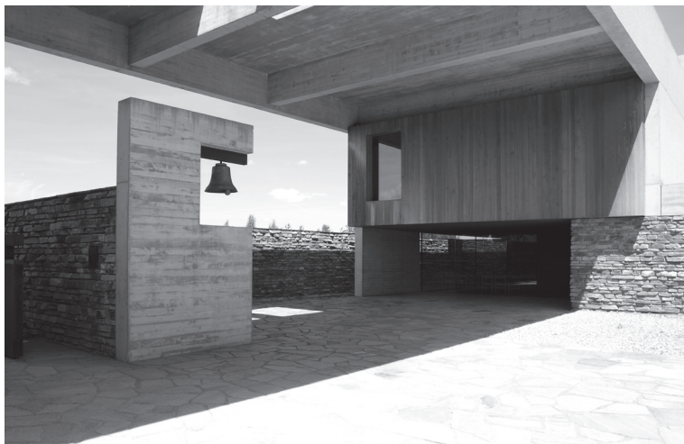
Cintorín v novej obytnej štvrti Riem v Mníchove je príkladom súčasnej minimalistickej sepulkralnej architektúry.