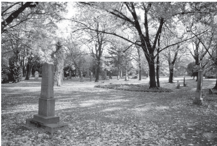
Historický Ondrejský cintorín v centre Bratislavy sa po revitalizácii využíva ako park.

Súčasnú európsku tvorbu pohrebných miest treba chápať v súvislosti s vývojom cintorínskej kultúry, a to najmä od jej rozmachu v dobe osvietenstva, keď bolo z hygienických dôvodov zrušené pochovávanie pri kostoloch (1765, Paríž). Nové cintoríny boli navrhované napr. ako tzv. elyzejské ( elyzium – sídlo blažených, raj) polia (Père Lachaise, Paríž, 1804) alebo monumentálny cintorín (Monparnasse, Paríž, 1801). Duch doby vyžadoval, aby cintorín okrem plnenia jeho základného účelu – pochovávaní, návštevníka aj vzdelával a morálne pozdvihoval. Zodpovedala tomu aj voľba rastlín, vysádzali sa tam lípy, platany, tuje, tisy a pagaštan konský ako symboly večnosti a pomínutelnosti. Z kríkov a kvetov boli obľúbené napr. brečtan, zimozelen a ruže. Všetky symbolizovali nepretržitú lásku a večnú spomienku. Pod vplyvom anglického parkového umenia, ale aj nemeckého romantizmu prinieslo 19. storočie záľubu v krajinárskom stvárnení plôch cintorínov. Filozoficko-etické predstavy smrti ako spánku sa naplňovali v sentimentálnom alebo radostnom duchu a viedli k zriaďovaniu pohrebných miest ako krajinárskych záhrad a lesných cintorínov (Jöckle, 2000). V Európe