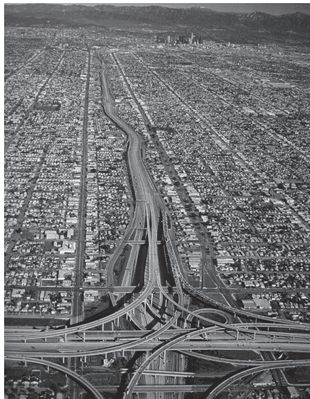
Predmestie Los Angeles, USA

Napriek všetkým zmenám súčasník má ešte stále potrebu poloverejnej „ulice“. Môžeme ju nazvať požiadavkou na nie úplne verejný priestor, ktorý by umožnil riešiť otázky: kde si možno urobiť piknik (ako kedysi v mestskom parku alebo v záhrade vnútrobloku), ako sa môcť zahrať s deťmi známych, ako žiť v komunite,