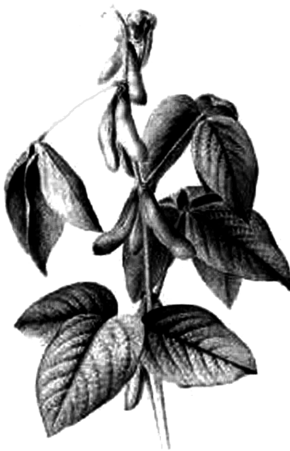
Sója je na prvom mieste (podľa plochy rozšírenia) medzi pestovanými kultúrnymi odrodami transgenných rastlín, hlavne v USA

Uvedený výběr je zatím velmi úzký. V laboratořích univerzit, vědeckých a výzkumných ústavů i biotechnologických firem jsou připraveny transgenní rostliny, které mají některé ze stovek, možná tisíců nových znaků.