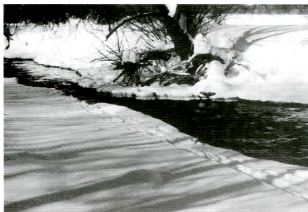
Stopová dráha vydry v čerstvom snehu na toku Tisovník

Mostové objekty na jednej strane predstavujú vhodné miesta z hľadiska pachového označovania teritórií trusovými alebo močovo-trusovými značkami, ale na druhej strane sa v prípade nepriechodnej konštrukcie stávajú výrazným negatívnym prvkom, zvyšujúcim mortalitu vydry. Zo sledovaného územia je dosiaľ známy len údaj o vydre zrazenej 9. 12. 1995 o 1.30 hod. v obci Stredné Plachtince. Zo všetkých sledovaných mostových objektov počas celoročných kontrol sme medzi nepriechodné