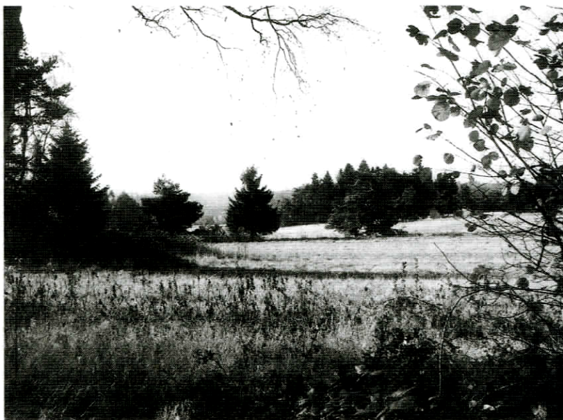
Horské louky v bývalém hraničním pásmu na Šumavě

Obecně používaná paralela s Rakouskem pokulhává.