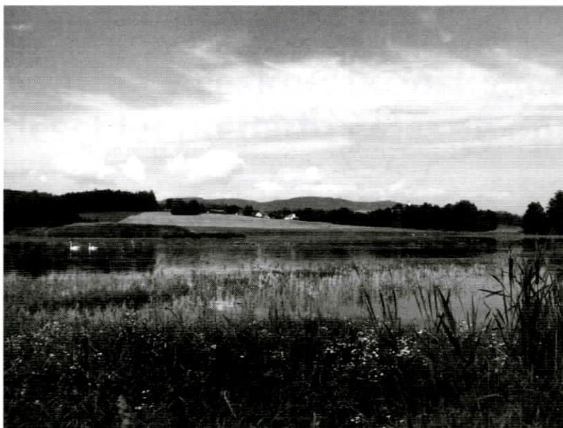
Krajina pod Blanským lesem

Poválečné dosídlení území probíhalo za výrazné účasti státu. Výsledkem tohoto procesu je však celkově nízká sídelní stabilita projevující se m.j. převahou emigrace z území, pro venkovské osídlení netypicky vysokým