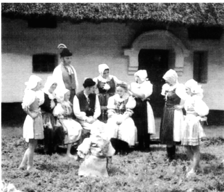
Brezová pod Bradlom

Obce, ktoré pre nedostatok financií nedostanú podporu tohto roku, avšak splnia určité kritéria, dostanú osvedčenie o tom, že sa zúčastňujú Programu obnovy dediny. Toto osvedčenie bude podporným argumentom pri žiadostiach zo štátnych fondov zameraných na dotačnú politiku, spravovaných ministerstvami pôdohospodárstva, hospodárstva, dopravy, pôšt a telekomunikácií, kultúry, školstva a životného prostredia. Podľa uznesenia vlády SR č. 222/97 sú správcovia fondov povinní považovať "účasť obce v obnove dediny" za závažné kritérium na pridelenie podpory zo štátneho fondu.