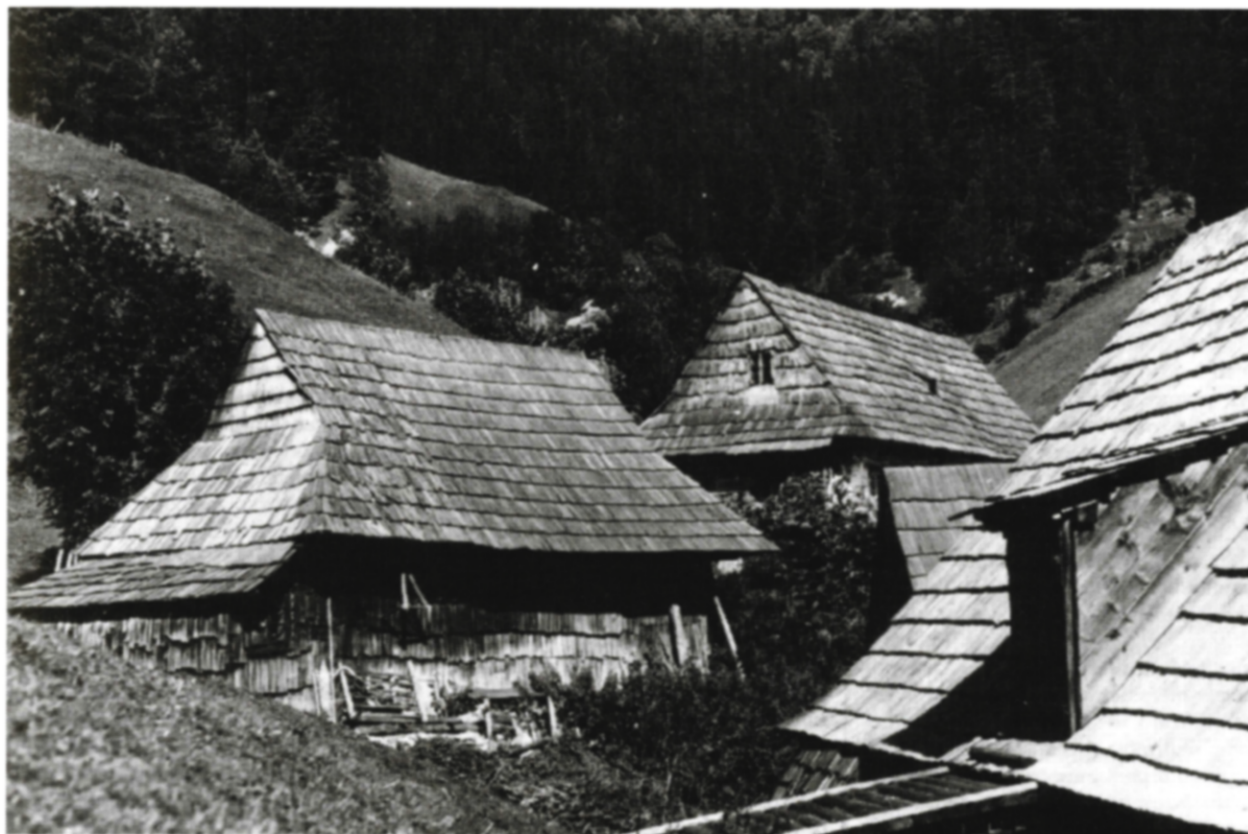
Osada Prašnica pod Veľkou Fatrou