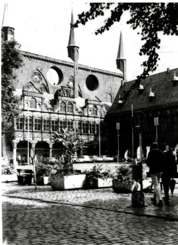
Radnica v Lübecku

s cieľom dať kultúrnemu a prírodnému dedičstvu primeranú funkciu v živote spoločnosti a otázky jeho ochrany zahrnúť do komplexných plánov rozvoja krajiny. Štát má prijať potrebné legislatívne, vedecké, technické, administratívne a finančné opatrenia na inventarizáciu, ochranu, obnovu, prezentáciu a využitie tohto dedičstva. Preto zriaďuje organizácie a služby, ako aj výchovné a vedecké pracoviská. Členské štáty Konvencie sa zaviazali na jednej strane poskytovať na požiadanie pomoc iným štátom, na druhej strane nepodnikať nič, čo by mohlo ohroziť kultúrne a prírodné hodnoty na území iných štátov konvencie. Zmyslom Konvencie je vytvoriť ucelený systém medzinárodnej spolupráce a podpory členských štátov v ich úsilí identifikovať a chrániť svetové dedičstvo.