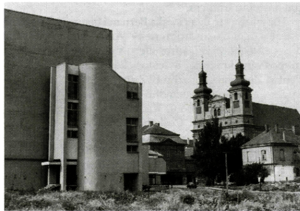
Vpád novej zástavby do historického jadra Trnavy