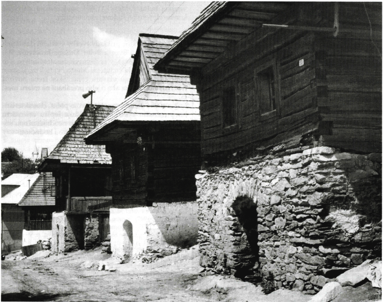
Ulica v Lome nad Rimavicou

Osobitnú psychologickú degradáciu u nás v minulých desaťročiach zaznamenala ľudová architektúra. O rapidnej prestavbe našich dedín v nedávnych časoch Podoba (1995) konštatuje, že jedným z jej znakov je manifestačný, ostentatívny konzum. Presadil sa normatívny systém, založený na kritériách kvantity, módnosti a vonkajšej reprezentácie blahobytu. Postoj ku kultúrnym pamiatkam (osobitne v prípade ľudovej architektúry) na Slovensku umocnilo deravé kultúrne povedomie; tento postoj si dobre rozumel so psychológiou a idelógiou režimu. Vlastne akoby im navzdory sa na Slovensku podarilo vyhlásiť niekoľko pamiatkových rezervácií ľudovej architektúry. Príznačné pre celkový zmatok zmýšľania je to, že krátko po novembri 1989 sa občania Osturne v mene VPN postavili za zrušenie pamiatkovej rezervácie ako pozostatku totality.(!) Aj dnes