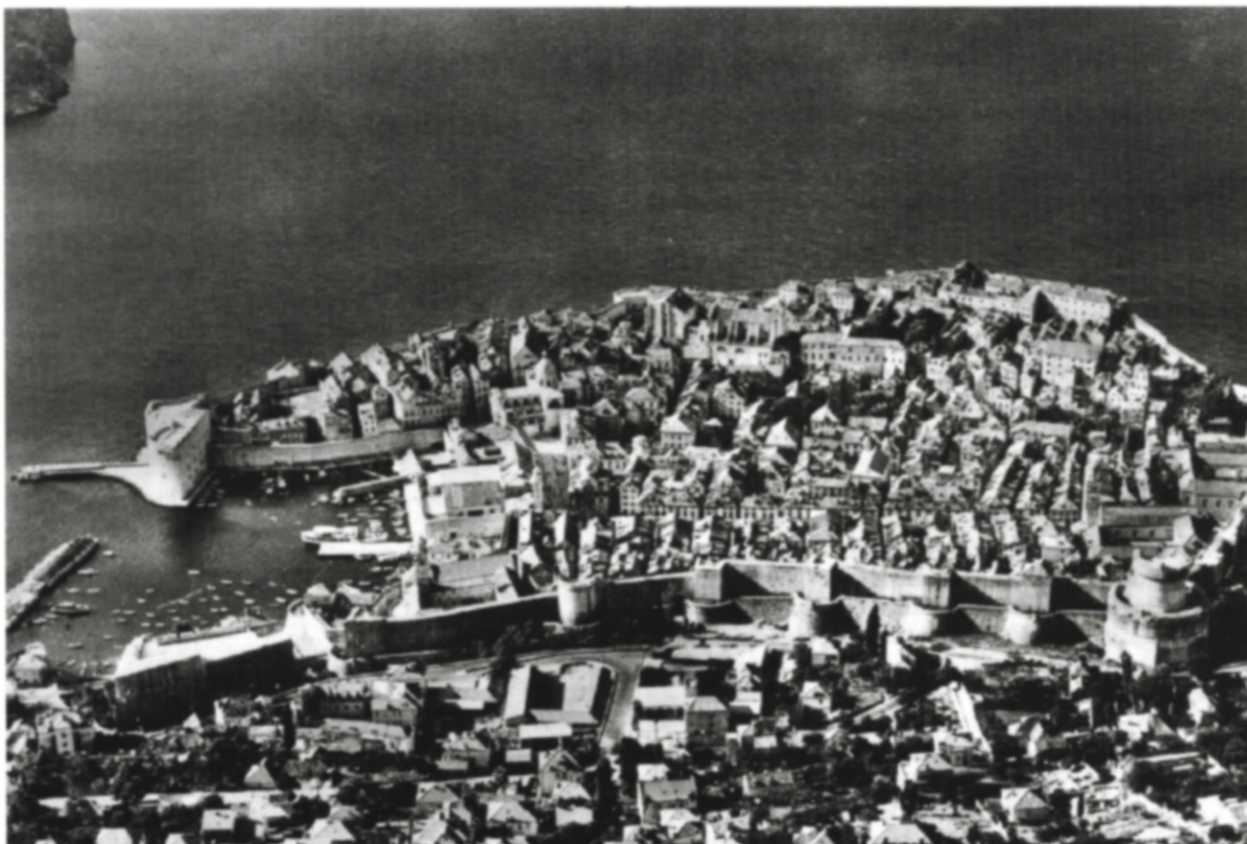
Pohľad na Dubrovnik

tamojších miest. U nás zbúrali v sedemdesiatych rokoch, okrem iného, faru v Čadci, kde zasadala SNR v meru ôsmom roku minulého storočia, s výraznou pamätnou tabuľou. Z Bulharska možno uviesť aj príklad Koprivštica – dôkladne rekonštruovaného svojrázneho celku s pôvabnou architektúrou, zároveň mesta významného pre národnú tradíciu.