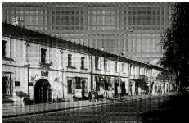
Martin súvisí predovšetkým s národnou históriou, mnohé objekty majú však aj svoju architektonickú hodnotu