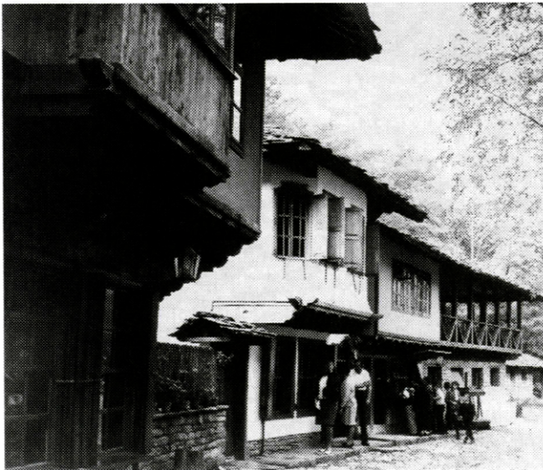
Remeselnícka ulička v Etare (Bulharsko)

i s celým prostredím. Marken je úplne zameraný na cestovný ruch. Dobrovodská (1995) zaznamenala zaujímavé údaje o postoji dánskeho obyvateľstva ku kultúrnemu dedičstvu vidieka.