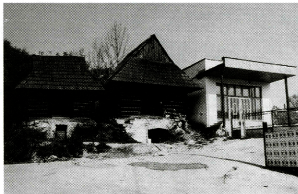
Necitlivé susedstvo na Orave – Sedliacka Dubová