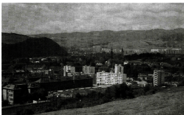
Banská Bystrica sa rozrástla do okolitej krajiny