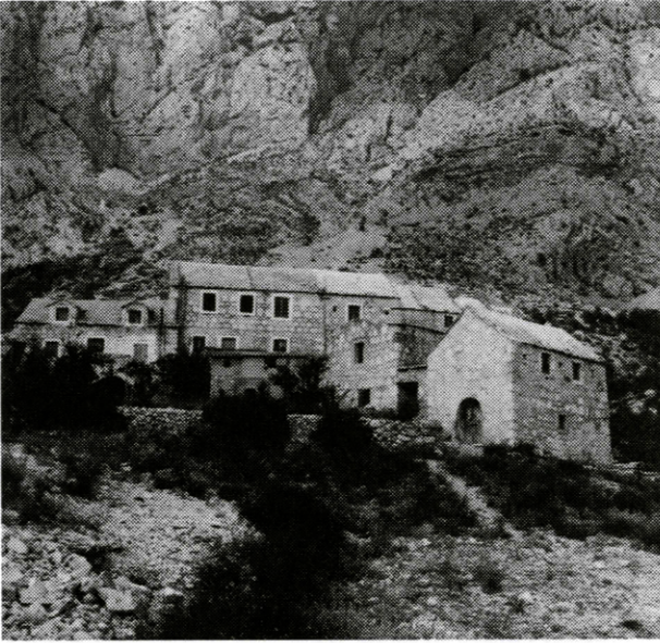
Osada v Dalmácii (Chorvátsko)

napr. v Rejdovej nesúhlasia s tým, aby ich obec bola vyhlásená za pamiatkovú zónu, namiesto aby to cháпали ako vec cti.