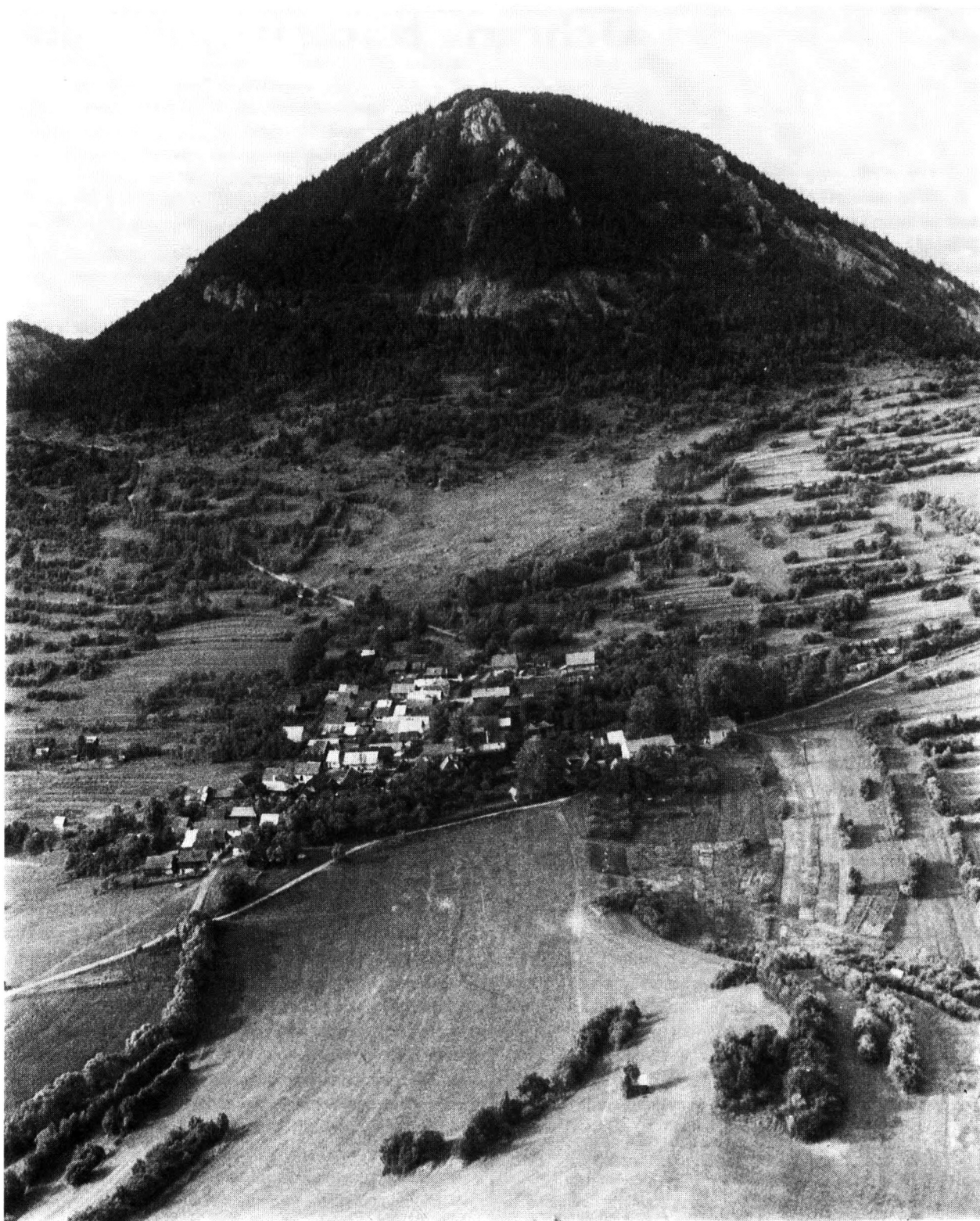
Historický urbanistický súbor - Pamiatková rezervácia ľudovej architektúry Vlkolíne