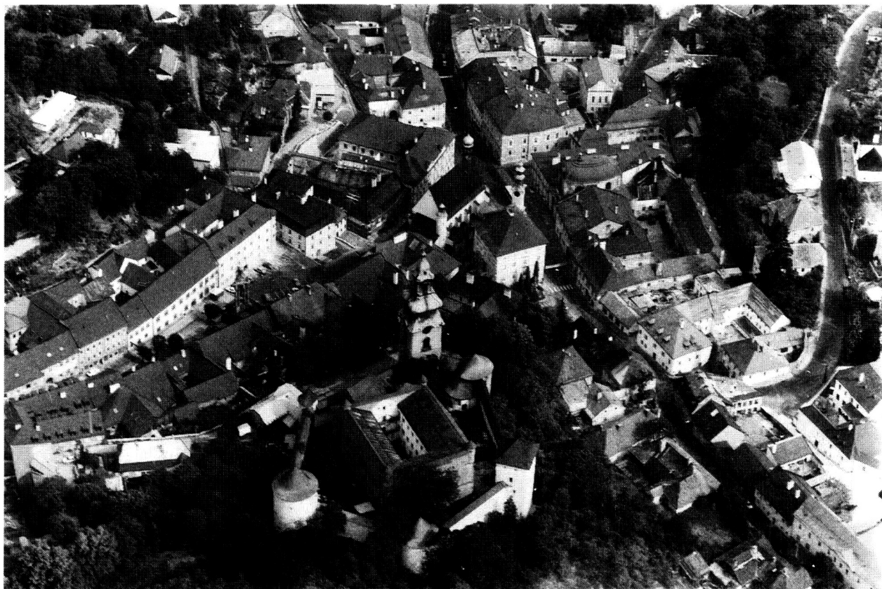
Detail historickej urbanistickej štruktúry MPR Banská Štiavnica - letecký pohľad

sociálneho rozvoja a musí sa s ňou počítať v plánoch úprav a urbanizmu na všetkých úrovniach.